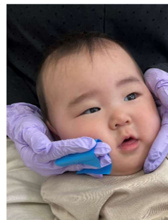
乳児の皮脂を採取