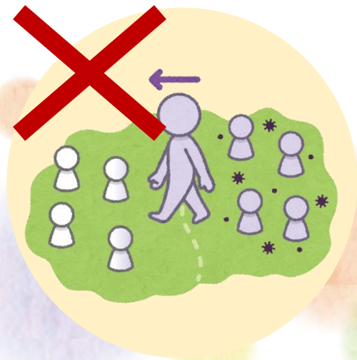
けんをまたいでのいどう 県をまたいでの移動