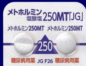
メトホルミン塩酸塩錠250mgMT「JG」