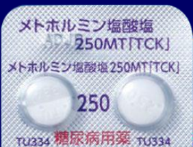
メトホルミン塩酸塩錠250mgMT「TCK」