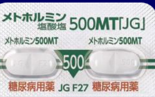
メトホルミン塩酸塩錠500mgMT「JG」