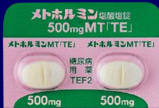
メトホルミン塩酸塩錠500mgMT「TE」