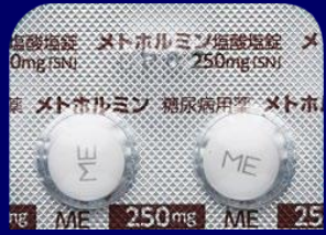
メトホルミン塩酸塩錠250mg「SN」