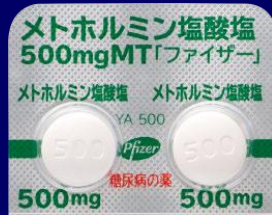
メトホルミン塩酸塩錠500mgMT「ファイザー」