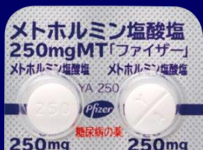
メトホルミン塩酸塩錠250mgMT「ファイザー」