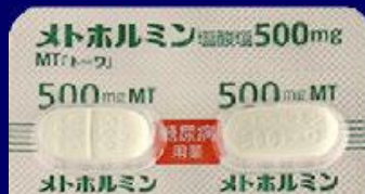
メトホルミン塩酸塩錠500mgMT「トワ」