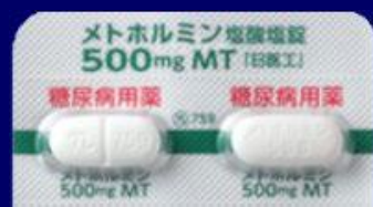
メトホルミン塩酸塩錠500mgMT「日医工」