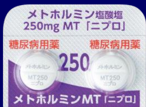
メトホルミン塩酸塩錠250mgMT「ニプロ」