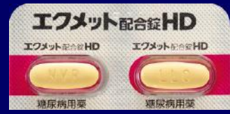
エクメット配合錠 HD