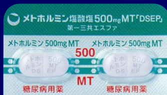
メトホルミン塩酸塩錠500mgMT「DSEP」