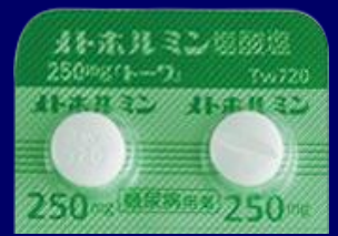
メトホルミン塩酸塩錠250mg「トーワ」