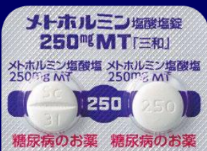
メトホルミン塩酸塩錠250mgMT「三和」