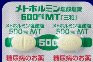
メトホルミン塩酸塩錠500mgMT「三和」