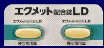
エクメット配合錠 LD