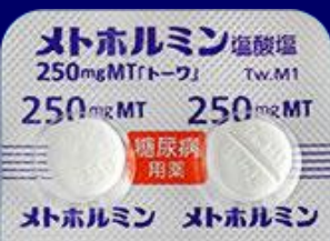
メトホルミン塩酸塩錠250mgMT「トワ」