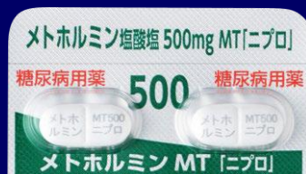
メトホルミン塩酸塩錠500mgMT「ニプロ」