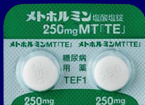
メトホルミン塩酸塩錠250mgMT「TE」