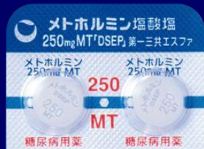
メトホルミン塩酸塩錠250mgMT「DSEP」