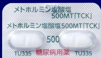
メトホルミン塩酸塩錠500mgMT「TCK」