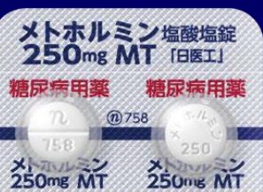
メトホルミン塩酸塩錠250mgMT「日医工」